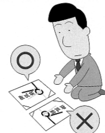
▲御仏前のお供えの向き